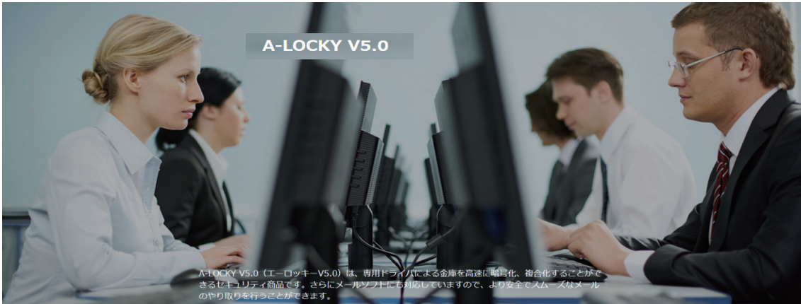
A-LOCKY V5.0 (エーロックキーV5.0) は、専用ドライバによる金庫を高速に暗号化、複合化することができるセキュリティ商品です。さらにメールソフトにも対応していますので、より安全でスムーズなメールのやり取りを行うことができます。